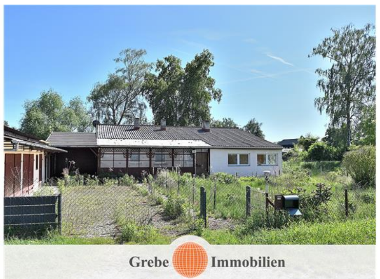
Flurstück 257 mit Bebauung