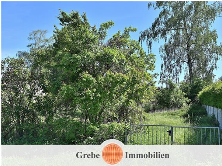
Flurstück 256 Bild 2