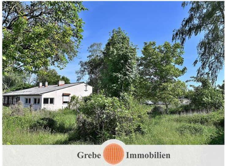
Flurstück 256 Bild 3